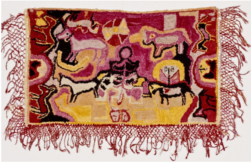
Rug, commercial yarns and dyes on burlap support. New Mexico, United States. Gift of the Historical Society of New Mexico, Museum of International Folk Art, A5.1954.8

What will you weave into your wall hanging?